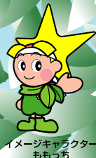
イメージキャラクター ももっち