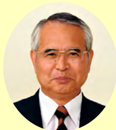
千葉 喬三 (岡山大学学長・農学博士) 4月18日(土)10時～12時